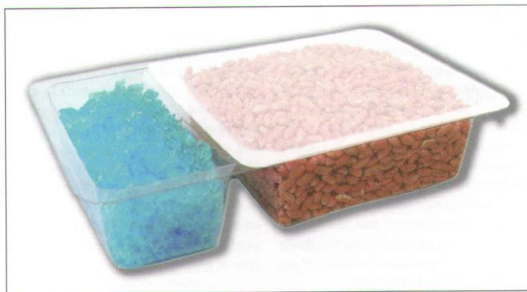
PROTECT Revolution® nástraha zabezpečuje r'apidnejšiu ochranu s vyššou efektivitou

Čo sa týka insekticídov, má Bábolna Bio, ako aj mnoho iných spoločností skúsenosti so